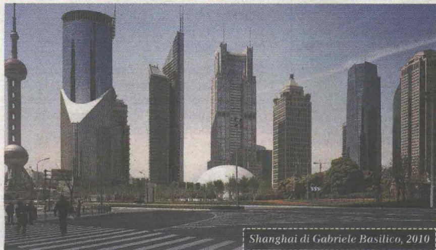
Shanghai di Gabriele Basilico, 2010