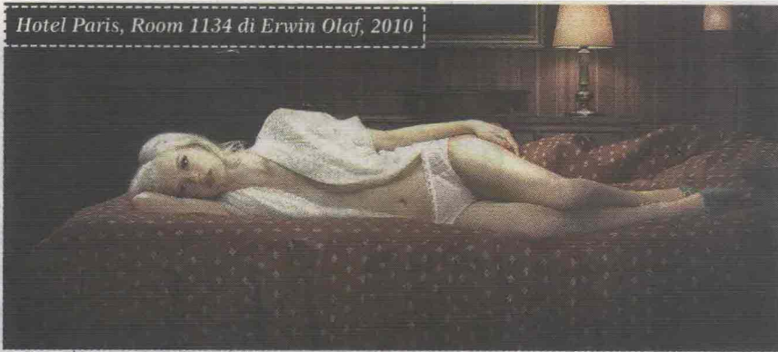
Hotel Paris, Room 1134 di Erwin Olaf, 2010

Milan Image Art Fair 2012 Dal 4 Al 6 Maggio 2012 Milano, Superstudio Più (Via Tortona, 27)